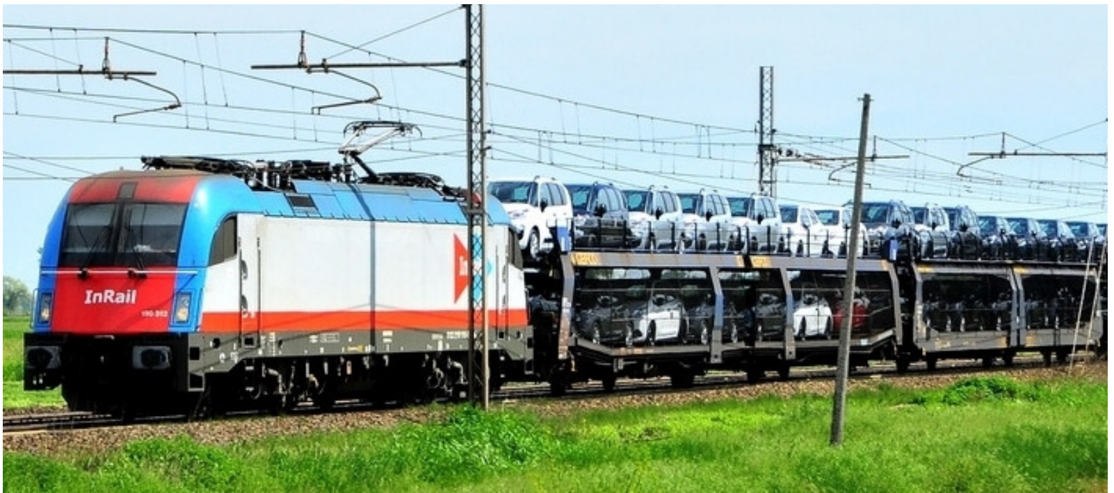
Der Bahngütertransport in Italien erreicht im Modal Split erst 13 Prozent – um 30 Prozent zu erreichen, sind erhebliche Infrastruktur-Investitionen zu tätigen.